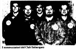
I sommozzatori del Club Subacqueo

L'ORGANICO della protezione civile grossetana si è ampliato con l'arrivo di una squadra di sommozzatori volontari (Smz). I componenti, tutti appartenenti al Club Subacqueo Grossetano, sono in possesso dei requisiti richiesti dal Ministero degli Interni e da quello della Protezione Civile e vengono in grado di operare all'interno delle squadre speciali-Smz.