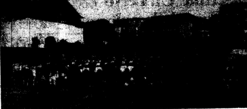
Nella foto il folto gruppo di ragazzi che fanno parte della scuola di calcio biancoscurosa e che partecipano al torneo «Galliani».

I giovanissimi del «Gianni Confezioni» saranno impegnati questo pomeriggio nella finale del Torneo di Poggioferro. I biancoscurosi sono arrivati alla disputa della partita conclusiva dopo aver battuto in successione Scansano (2 a 1 il risultato finale) e Invicita (3 a 1). Questo pomeriggio i tormalini cercheranno di bissare il successo di Istria e confermare quindi quanto di buono avevano fat-